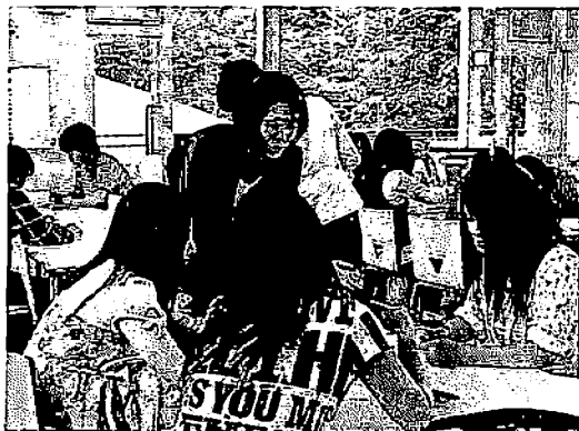
写真3・4 キャリア支援講座風景